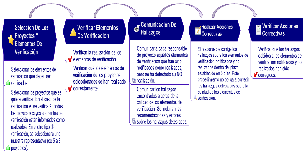
Fig. 6. Proceso de Verificación de TestPAI.